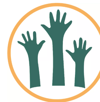
Encouraging and monitoring voluntary commitments to act for the vision