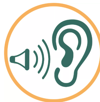
Amplifying rural voices and bringing them higher on the political agenda