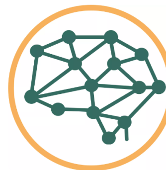
Structuring and enabling networking, collaboration & mutual learning