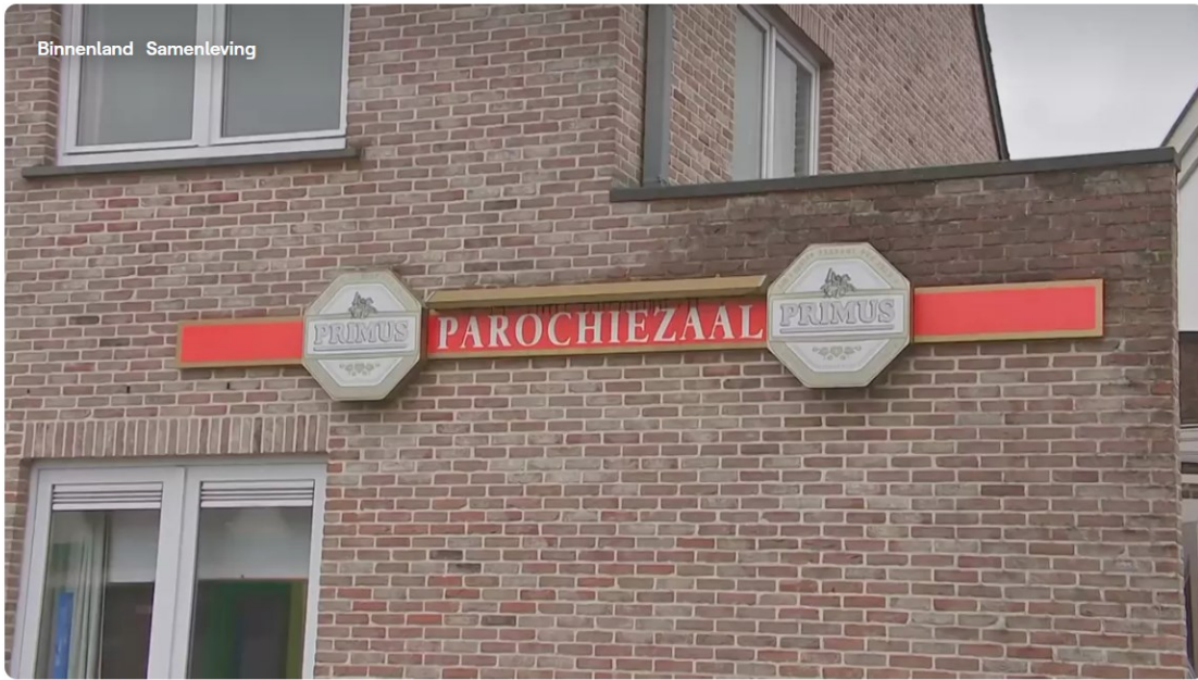
Een dorpszaal is meer dan een klassieke parochiezaal.